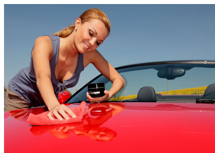
Cuidado del coche con cera de carnauba