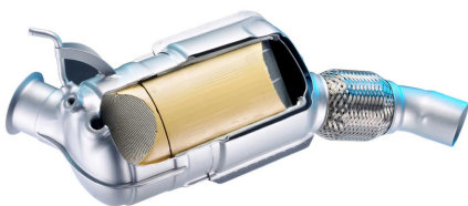
Filtro de partículas