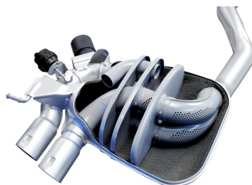
Carcasas de silenciador