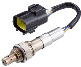
Sonda de banda ancha