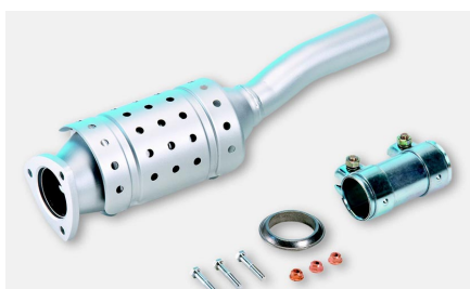
Piezas de montaje