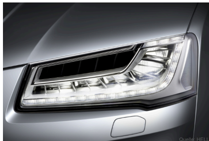
Matrix LED-Scheinwerfer von HELLA